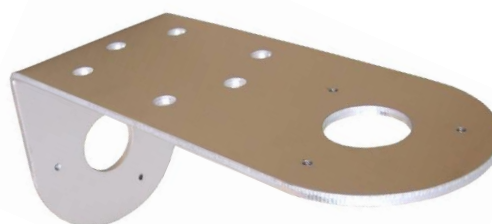
plech ( telo držiaka ) DAH100L TWIN-C